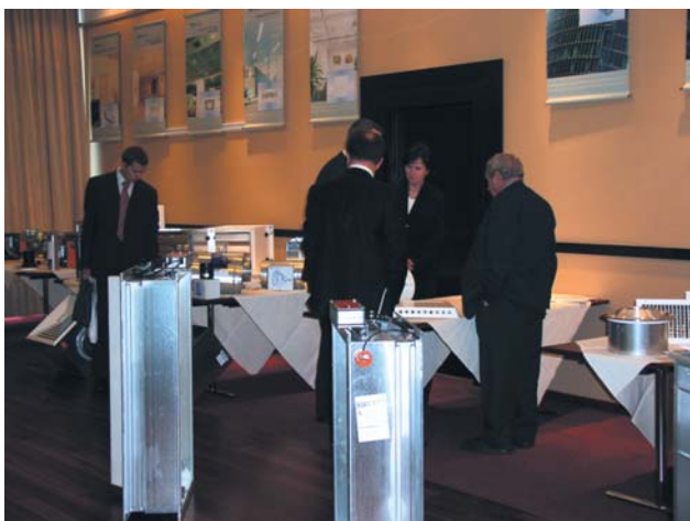
Foto 2. Fragment ekspozycji