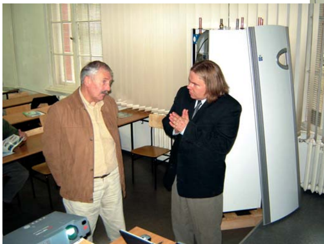
Fot. 4. Podczas przerwy nie było mowy o odpoczynku