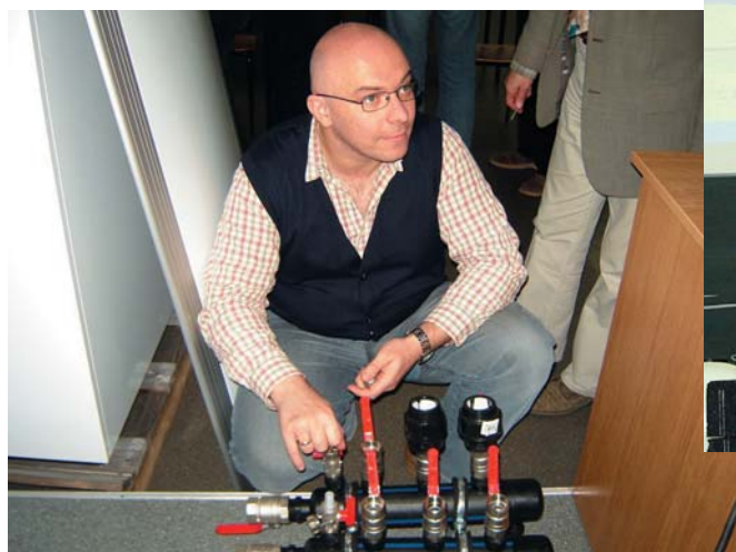
Fot. 5. Uczestnicy spotkania mieli okazję z bliska przyjrzeć się elementom instalacji dolnego źródła ciepła