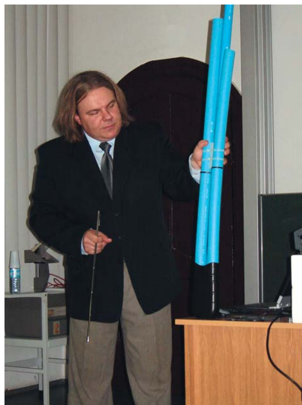
Fot. 3. Pośród wielu eksponatów znalazło się zakończenie gruntowego pionowego wymiennika ciepła