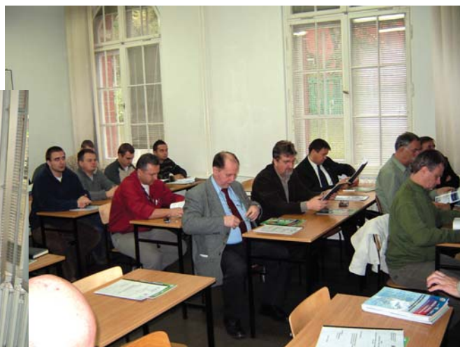
Fot. 7. Każdy uczestnik seminarium otrzymał komplet materiałów