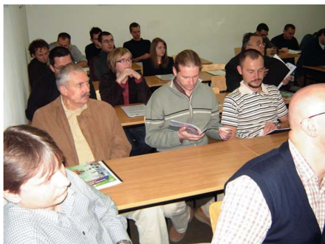
Fot. 6. Na sali tradycyjnie nie zabrakło przedstawicieli firm branżowych, pracowników naukowych oraz studentów

rzeczywistych egzemplarzy wybranych podzespołów spotkał się z dużym zainteresowaniem uczestników spotkania.