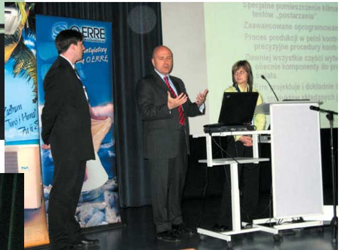
Przedstawiciele firmy O.ERRE