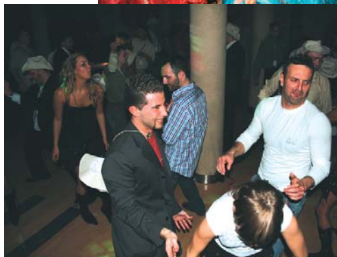
A tańce trwały do wczesnych godzin rannych

kreślić znakomite opanowanie przez referenta naszego, przecież niełatwego języka, bowiem całość materiału przedstawił on właśnie w języku polskim.