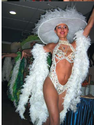
Wspaniały zespół taneczny z Kaliningradu