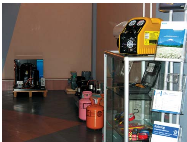
Oferta sprzętu chłodniczego