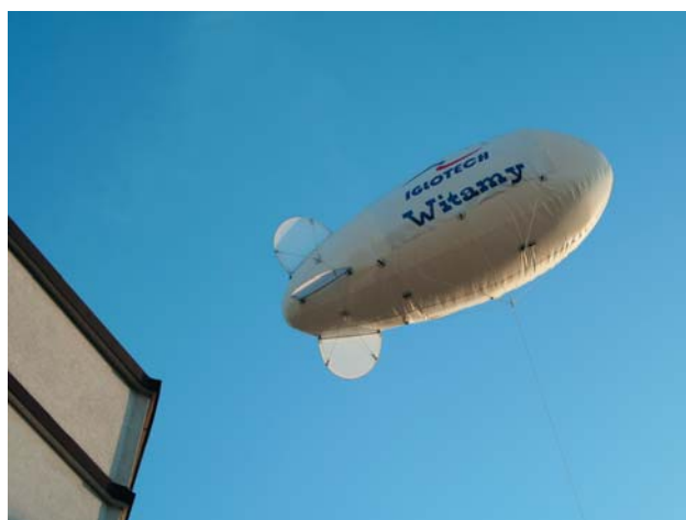
Balon z logo firmy IGLOTECH