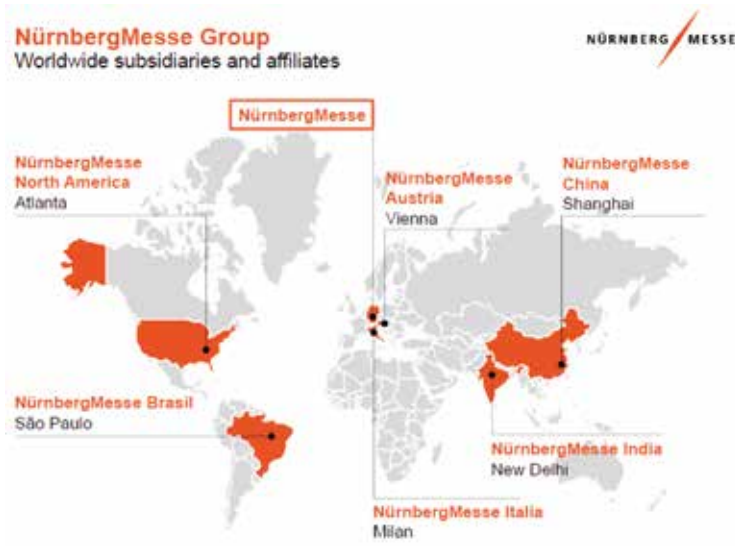
Rys. 6. Targi Norymberskie rozwijają działalność wystawienniczą nie tylko w Europie