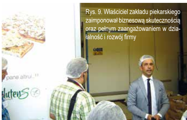
Rys. 9. Właściciel zakładu piekarskiego zaimponował biznesową skutecznością oraz pełnym zaangażowaniem w działalność i rozwój firmy