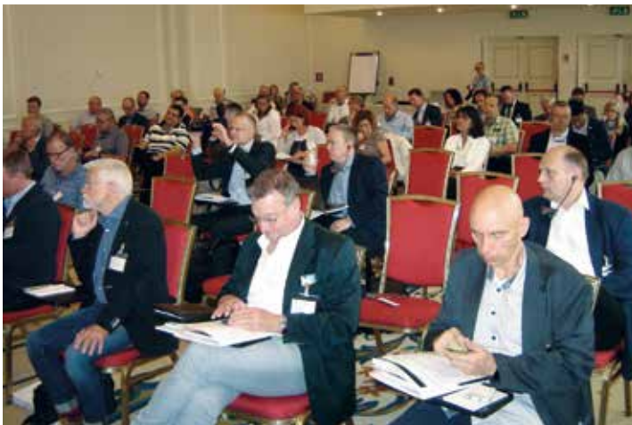
Rys. 4. W spotkaniu w hotelu Grand Visconti Palace udział wzięło ok. 60 dziennikarzy i przedstawicieli komitetu wystawienniczego