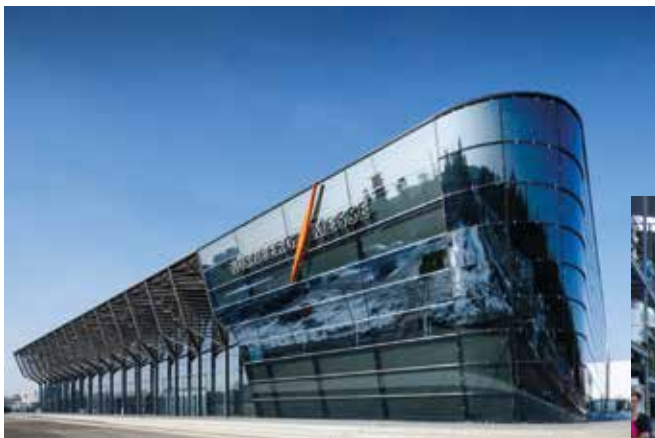
Rys. 7. Wizja wnoszonej obecnie hali 3C (Copyright NürnbergMesse/Zaha Hadid Architects)