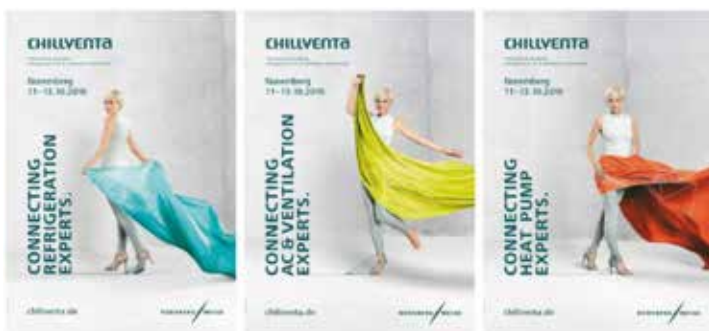
Rys. 5. Poszczególnym branżom przypisano różne barwy rozpoznawcze (od lewej: chłodnictwo, wentylacja i klimatyzacja oraz pompy ciepła)

macjami technicznymi na temat targowej infrastruktury klimatyzacyjnej, pamiętając o specyfice branżowego audytorium. Co więcej, firma Nürnberg Messe dużo uwagi poświęca energetycznej efektywności eksploatowanych instalacji i dba o racjonalną gospodarkę energią (rys. 8). Dzięki temu jej kompleks targowy jako pierwszy na świecie spełnił wymogi normy ISO 50001, zaś halę 3A wyróżniono – również jako pierwszą – Niemieckim Certyfikatem Budownictwa Zrównoważonego DGNB. Dąży się do tego, aby nowo wznoszona hala 3C również czyniła zadość tym standardom. Zatem w przypadku organizatora Chillventy – imprezy