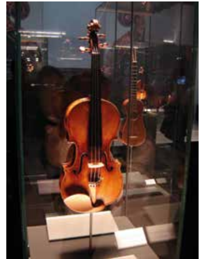
Rys. 10. Ukoronowaniem pobytu w muzeum wiolinistycznym był krótki koncert prezentujący brzmienie jednego z oryginalnych dzieł Stradivariusa