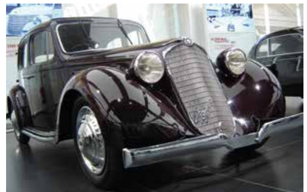
Rys. 12. Wizyta w muzeum Alfa-Romeo nie była przypadkowa – elegancja, innowacyjność i niezawodność to cechy przynależne także targom Chillventa