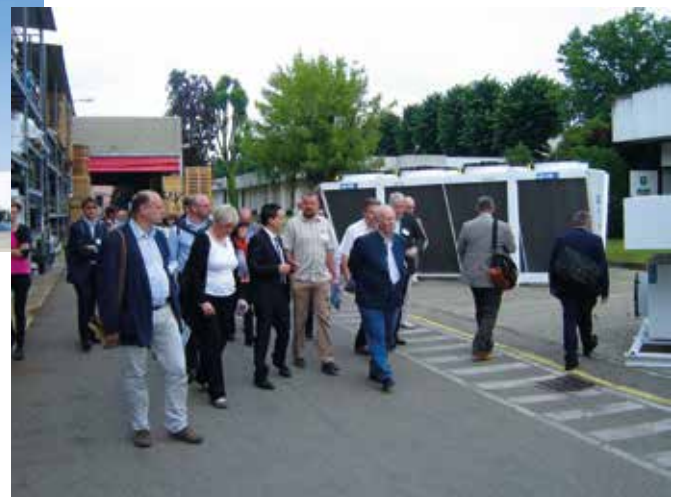
Rys. 11. W siedzibie firmy LU-VE